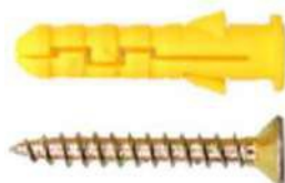
30 мм анкер М6, винт М4 (3 комплекта)