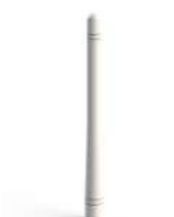
Антенна (3 шт.)