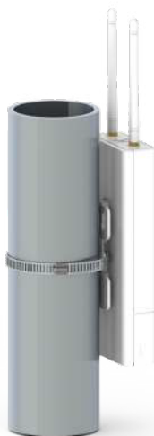
Рис. 2.3: Установка шлюза MX1901/2 на опору.