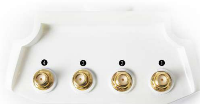
Рис. 1.2: Антенные разъемы шлюза MX1901/2.