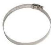
Зажим из нержавеющей стали (1 шт.) (1 шт.)