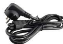
24В POE ( 1 шт.)