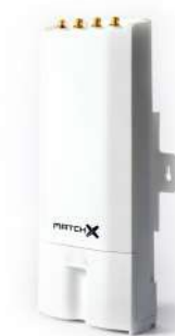
Шлюз MX1901/2 (1 шт.)

Комплект поставки не содержит кабелей Ethernet, так как их длина и тип зависят от установки.