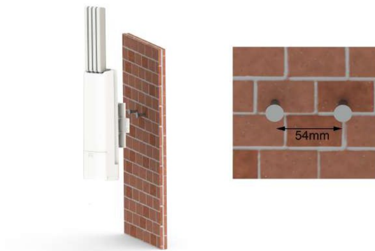
Рис. 2.2: Установка шлюза MX1901/2 на стену.